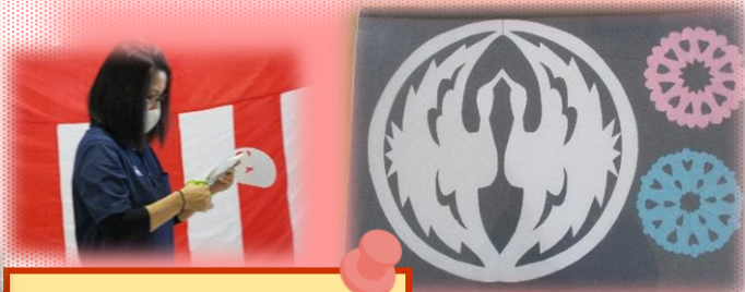
切り絵 長寿を祝うおめでたい鶴！