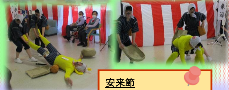
安来節 コソ泥が乱入し大騒動に！