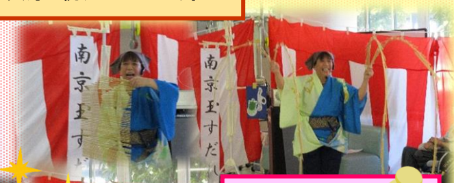
南京玉すだれ アさて、アさて、さては 南京玉すだれ〜♪招福 の伝統芸能で長寿をお 祝いします！