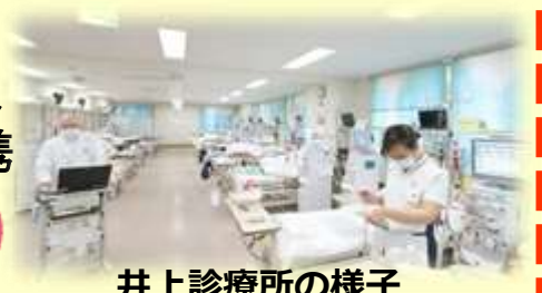
井上診療所の様子