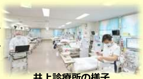
井上診療所の様子