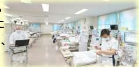
井上診療所の様子