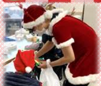
クリスマスカードのプレゼント！