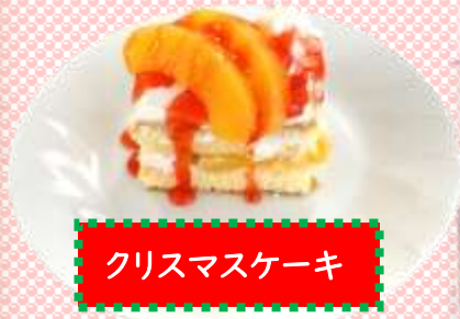
クリスマスケーキ