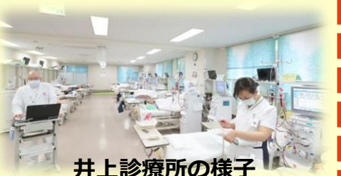
井上診療所の様子