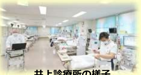
井上診療所の様子