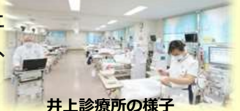
井上診療所の様子

4月9日、23日の統一地方選挙の不在者投票を行いました。35名の方が参加されました！