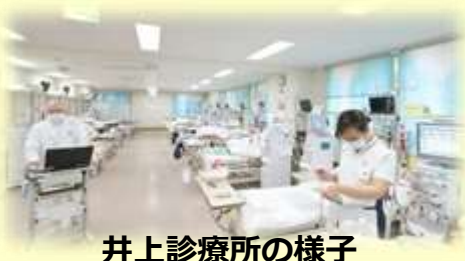
井上診療所の様子